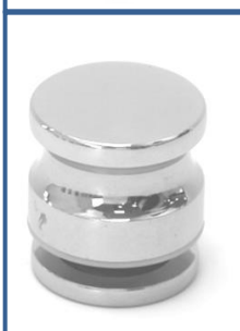
Ref.:11GT01 Tirador Gregal – 35 Ø +- Latón Taladros desde 12 a 14 mm Ø