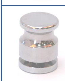
Ref.:11ENT01 Tirador enano tapa 25 Ø Taladros desde 12 a 14 mm Ø