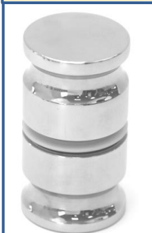
Ref.:11G01 Tirador Gregal – 35 Ø +- Latón Taladros desde 12 a 14 mm Ø