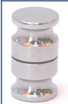
Ref.:11EN01 Tirador enano 25 Ø Taladros desde 12 a 14 mm Ø