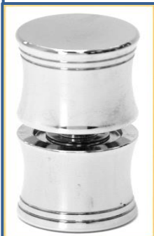
Ref.:11BR01 Tirador Bayona rayas latón Ø 30 Taladros desde 12 a 14 mm Ø