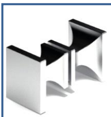
Ref.:11MT771.40 Tirador Cuadrado Zamak 40X40 Taladros desde 12 a 14 mm Ø